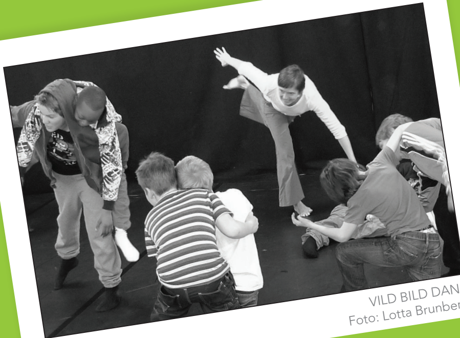
VILD BILD DANS