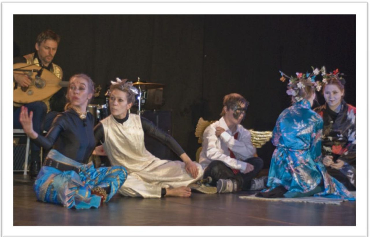
Ur 'Inte en levande själ....' Fokets Hus i Hallstavik den 24 april 2009.